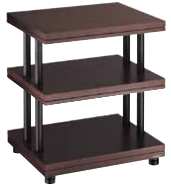
▲ CSR-3S-D ● カラー：ダーク(D)