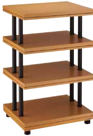
▲ CSR-4S-L ● カラー：ライト(L)