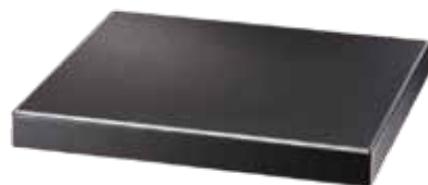
SCB-RS-HC45G/B SCB-RS-HC50G/B SCB-RS-HC65G/B