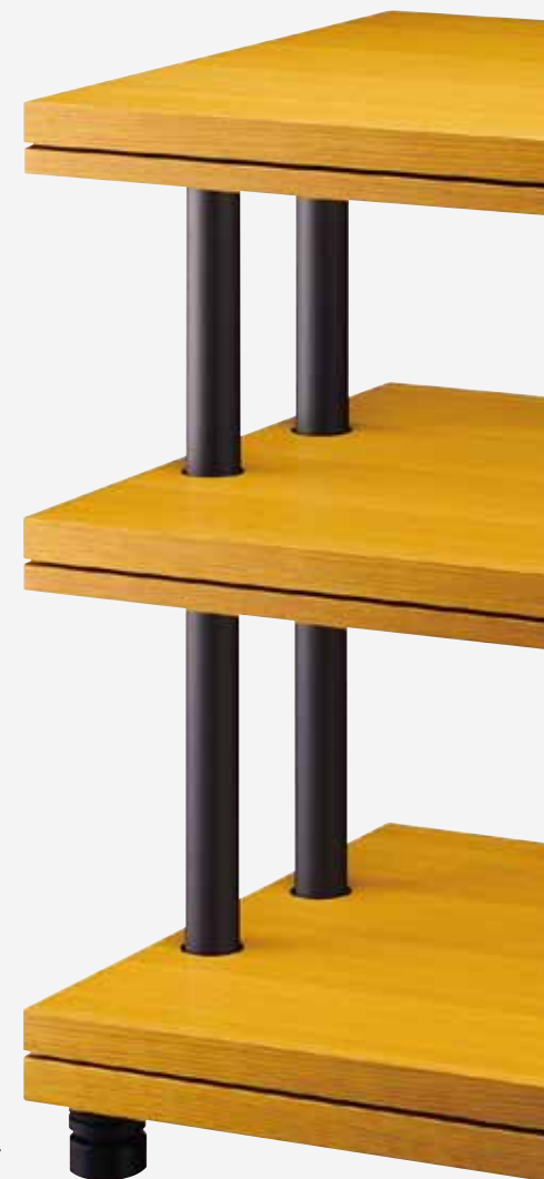
TAOC オーディオラック フラッグシップ・CSRシリーズ

注意： TAOC製品は重量があるため、取扱には十分ご注意ください。また使用前に必ず「取扱説明書」をよくお読みください。