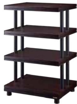
CSR-1S-L/D CSR-2S-L/D CSR-3S-L/D CSR-4S-L/D

脈々と受け継ぐTAOC独自の技術研究の結晶とも言えるオーディオラックは、適切な制振性を備え、オーディオシステム全体をより優れたサウンドに引き上げます。現在では国内外のオーディオ愛好家様以外をはじめ、最高品質の音を求めて一切の妥協なく、音を正しく見極める事を目的とする、「優れた音響メーカーの研究室や試験室のリファレンス」として愛用されており、さらには徹底的に音にこだわる「国内屈指の音響スタジオ」などでも幅広く導入されています。