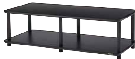
CL-1L-DB/DG CL-2L-DB/DG CL-1W-DB/DG CL-2W-DB/DG