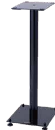
BST-50M/L BST-60M/L BST-70M/L