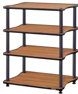
XL-1S-WL/WD XL-2S-WL/WD XL-3S-WL/WD XL-4S-WL/WD XL-1L-WL/WD XL-2L-WL/WD