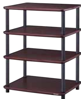
CL-1S-DB/DG CL-2S-DB/DG CL-3S-DB/DG CL-4S-DB/DG