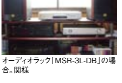
オーディオラック「MSR-3L-DB」の場合。関様

明度の高い音と、モールドメイブルの自然素材が持つ人間の聴感に心地良い感覚の魅力的な音が、見事に調和された結果ではないでしょうか。